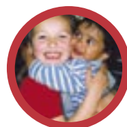
Forespørsel om barn er akseptert