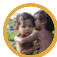
Papirene er i utlandet - ventetid