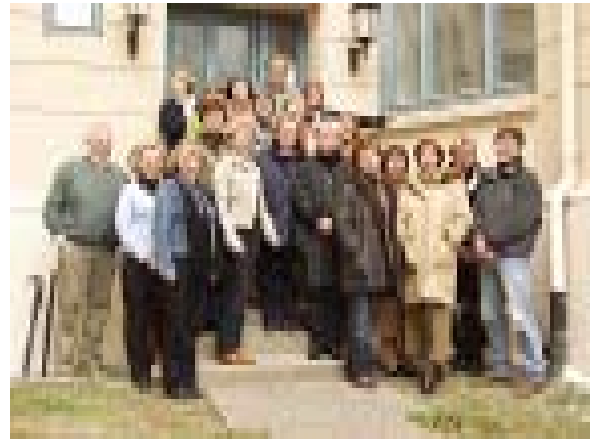
El Secretariado de Adopsjonsforum

El objetivo de Adopsjonsforum no es realizar la mayor cantidad de adopciones. El interés de nuestra Organización es llevar a cabo solo aquellas adopciones en las que sea claro, que ésta figura, va a favorecer el interés superior del menor y que sean las autoridades competentes, del país de origen, quienes lo establezcan. Adopsjonsforum les