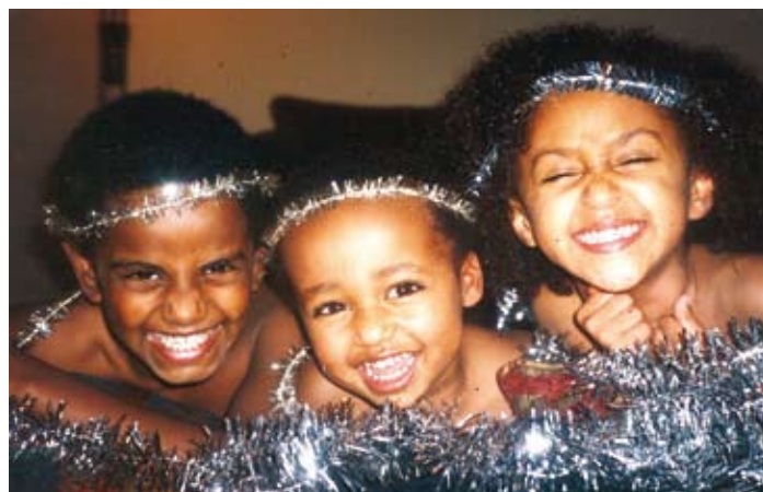
La gran mayoría de los niños adoptados se han integrado muy bien en sus nuevas familias y nuevos países.

Con relación a la edad, podemos ayudar a ubicar niños de 4 y 5 años de edad sin mayores dificultades. Tratamos de conseguir familias para niños mayores, pero a medida que el niño sea mayor la dificultad crece. La dificultad se presenta no solo porque la mayoría de solicitantes desean adoptar un menor lo más pequeño posible, sino porque el Directorado Noruego de asuntos de la Infancia, la Juventud y la Familia, considera que los padres adoptivos de niños mayores deberán estar mucho más calificados.