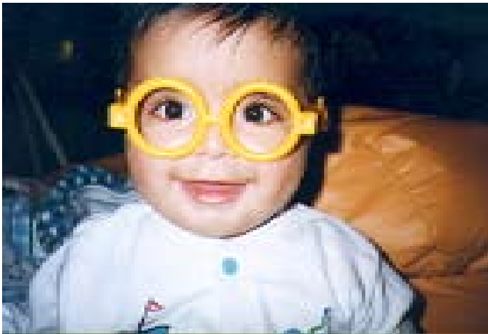
Adopsjonsforum es la organización de Adopción más grande en Noruega.

A finales de la década de los setenta, el Gobierno noruego formalizó las actividades de la Adopción Internacional, introduciendo entre de otras cosas un sistema de aprobación de las organizaciones de adopción. Adopsjonsforum obtuvo su primer permiso para trabajar con adopción internacional en 1978 junto con otras dos organizaciones. En la actualidad siguen siendo solo tres las organizaciones que en Noruega trabajan con adopción internacional. Las tres organizaciones trabajan de manera mancomunada en los temas que les conciernen. Adopsjonsforum es la más grande ya que realiza más de la mitad del total de adopciones. Si miramos a